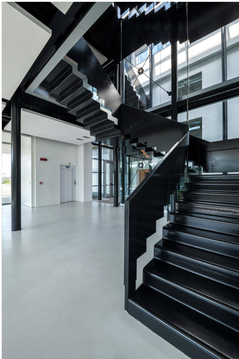
Vedi Scheda Progetto