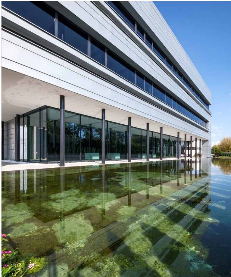
Vedi Scheda Progetto