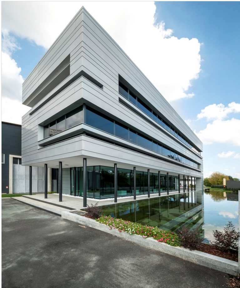
Vedi Scheda Progetto