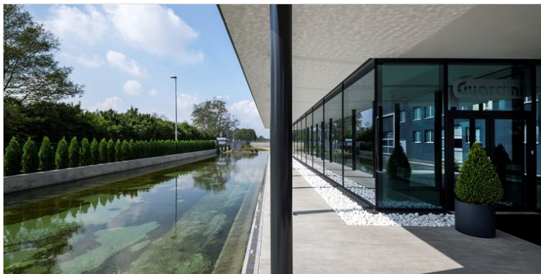
Vedi Scheda Progetto