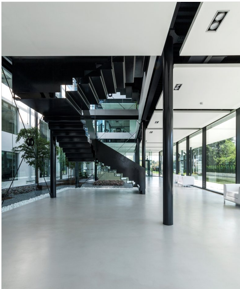
Vedi Scheda Progetto